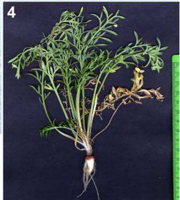
1) Maca en el mercado en Arequipa; 2) Órganos reservantes de maca; 3) Semillas; 4) Hábito; Fotos: 1, 3: Nicolas Dostert; 2: José Roque; 4: Maximilian Weigend